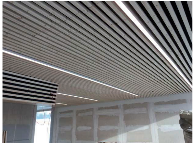
Deckenelemente mit akustisch wirksamer Akustik-Dämmauflage in Werkstatt vorgefertigt