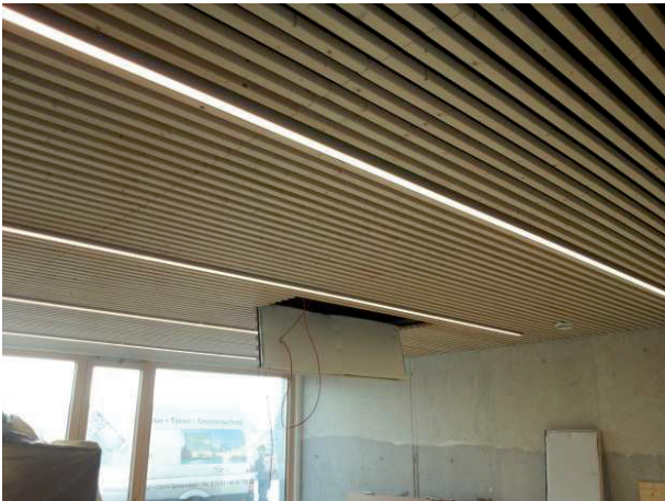
Abgehängte Holzlamellendecken, ca. 1.000 qm

Objekt: Kinderhaus Urbach Fertigstellung: Dezember 2012