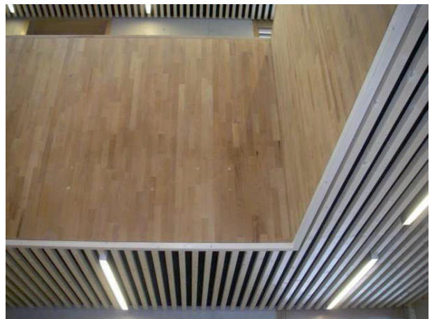
Alle Deckenelemente sind zu Revisionszwecken werkzeuglos abklapp- und verschiebbar

Ihr Partner für klassische Zimmerarbeiten und funktionalen Deckenbau